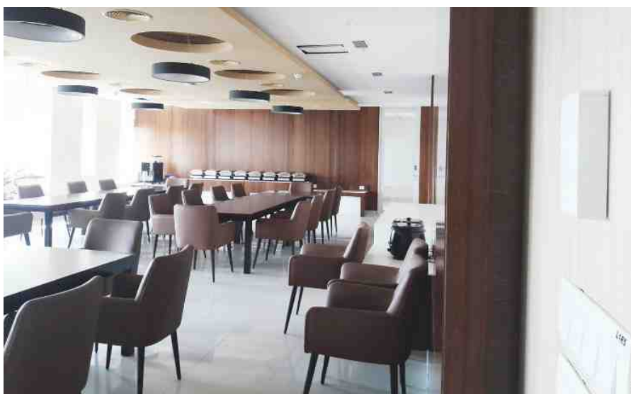
班加罗尔园区一间餐厅安装的暖通空调传感器（印度班加罗尔）。