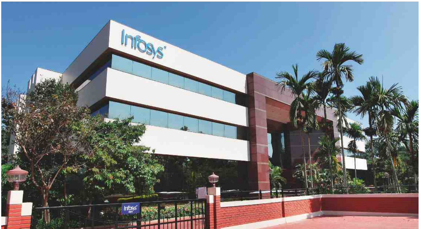
Infosys 总部位于印度班加罗尔。

Infosys 是印度第二大IT咨询公司，在全球拥有 200,000 多名员工，营收超过 100 亿美元。该公司总部位于班加罗尔，在印度设立的开发中心逾 16 家，另在中国设有一家园区。目前，Infosys 在其所有自建园区及办公楼宇项目中使用的均是维萨拉暖通空调传感器。