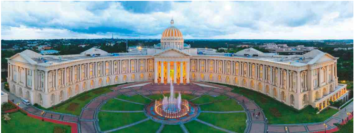
迈索尔园区的 Infosys 全球教育中心 (GEC) (印度迈索尔)