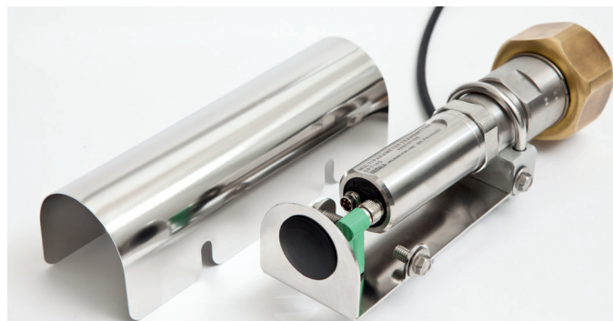
配有室外防护罩的DPT145

维萨拉拥有七十多年的丰富测量经验与知识。DPT145将成熟的DRYCAP®露点传感器技术和BAROCAP®压力传感器技术集成于一体，为SF6气体监测提供了创新便利的解决方案。