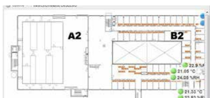
Mesures en continu affichées sur un plan du site