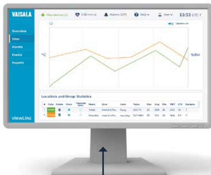
Graphique d'analyse comparative des conditions actuelles et historiques.

Depuis près de 20 ans, viewLinc fait l'objet d'un développement continu qui s'appuie sur les commentaires des utilisateurs. viewLinc, un logiciel convivial et fiable, associé à des appareils précis, est conçu pour répondre aux besoins des applications soumises à la réglementation GxP et aux autres applications exigeantes.