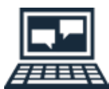
Aide à l'écran

Depuis près de 20 ans, viewLinc fait l'objet d'un développement continu qui s'appuie sur les commentaires des utilisateurs. viewLinc, un logiciel convivial et fiable, associé à des appareils précis, est conçu pour répondre aux besoins des applications soumises à la réglementation GxP et aux autres applications exigeantes.