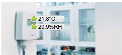
Mesures en continu affichées sur une photo réelle de l'environnement surveillé