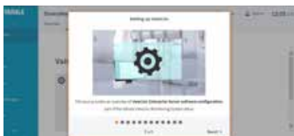
Les tutoriels expliquent comment utiliser le logiciel : configurer viewLinc, créer une zone, créer un lieu, ajouter un utilisateur, et bien plus