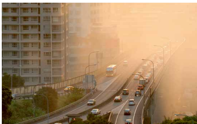
PWD52非常适用于气象与环境观测网络。