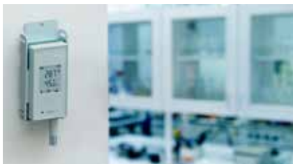
VaiNet RFL100 无线电频率数据记录仪

维萨拉 VaiNet 无线技术使用 sub-GHz 频率在环境监测应用中实现更好的信号传播。大多数配备无线设备的工业监测系统都采用某种冗余方式防止数据记录仪网络中出现单点故障。VaiNet 通过在多个网络接入点之间分配信号负载形成冗余。接入点和数据记录仪之间的无线信号强度决定了最佳数据传输路径。接入点利用以太网供电 (PoE)，从而减少布线，并且可以轻松连接到 UPS*。如果没有 PoE，则安装时提供单独的电源。此外，大多数 RFL100 型号都是完全无线的，由电池供电，可确保系统在停电期间继续监测。如果无线网络掉线，每个记录仪可以保留长达 30 天的数据，并且，如果以太网局域网出现故障，接入点将进行额外的数据存储。一旦网络恢复，数据记录仪和接入点就会自动将历史数据回填到监测系统软件，以确保历史记录不间断。