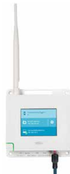
VaiNet AP10 网络接入点

维萨拉 viewLinc 监测系统利用基于射频技术的维萨拉 VaiNet 无线设备对环境条件进行无线跟踪。通过线性调频扩频 (CSS)* 信号调制, VaiNet 提供稳定的通信, 在长距离范围内以及严酷、复杂和闭塞的条件下依旧可靠。长距离无线通信避免了使用中继器来提高信号强度。VaiNet 的无线数据记录仪以及接入点已经进行了预编程, 以便于可以相互定位并建立通信。更少的设备和配置让安装更加简单, 因此, 即使是之前缺乏或者没有设置联网监测系统经验的用户也能部署它。