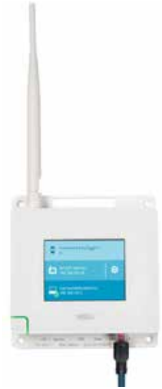
VaiNet AP10 网络接入点

维萨拉 viewLinc 监测系统利用基于 LoRa®* 技术的维萨拉 VaiNet 无线设备对环境条件进行无线跟踪。通过线性调频扩频 (CSS)* 信号调制, VaiNet 提供强大的通信, 在长距离范围内以及严酷、复杂和闭塞的条件下依旧非常可靠。长距离无线通信避免了使用中继器来提高信号强度。VaiNet 的无线数据记录仪以及接入点已经进行了预编程, 以便于可以相互定位并建立通信。更少的设备和配置让安装更加简单, 因此, 即使是之前缺乏或者没有设置联网监测系统经验的用户也能部署它。