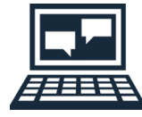
Orientação na tela

Os coletores de dados VaiNet estabelecem conexão com o viewLinc Cloud assim que são ligados e se recuperam automaticamente de interrupções de energia e rede. Os parâmetros disponíveis incluem temperatura, umidade relativa e dióxido de carbono.