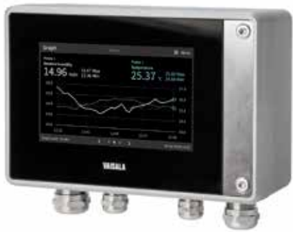
Indigo 520 变送器