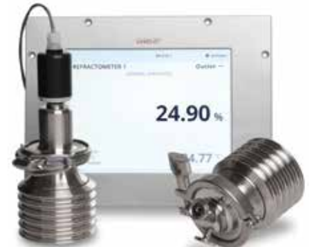
维萨拉 K-PATENTS® PR-43-PC 药物折光仪

通过对溶液的折射率进行光学测量来确定溶解固体的浓度。这一原理的优势在于:它在整个产品生命周期中增强了对过程的理解,并对有效药物及其高效制造过程的开发做出了重大贡献。示例应用包括活性药物成分 (API)、生化/生物聚合物 (包括疫苗、抗生素、蛋白质和缓冲液) 的处理。维萨拉 K-PATENTS 折光仪是理想的过程分析技术 (PAT) 工具。