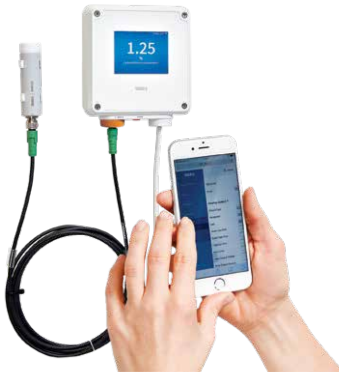
带 GMP251 二氧化碳探头的 Indigo 200 变送器

培养箱要求精确控制温度、相对湿度和二氧化碳。获得专利的维萨拉 CARBOCAP® 二氧化碳传感器已经成为培养箱使用的标准。维萨拉 CO 2 设备具有卓越的长期稳定性，是理想的参考测量设备。每个传感器都具有内置的温度/压力补偿功能，能够在高湿度环境中可靠工作。