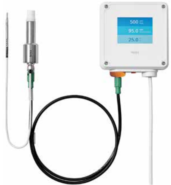
带有 Indigo 202 的维萨拉 PEROXCAP® HPP272