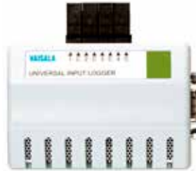
DL4000 通用输入数据记录仪

DL4000 通用输入数据记录仪是用于以下场合的简易解决方案：记录和监测压力、流量、液位、pH、电力性能、湿度及气体浓度。