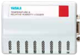
DL2000 相对湿度和温度数据记录仪

DL2000 数据记录仪将内部温度和相对湿度传感器与可选的用于电流或电压输入的外部通道相结合，可记录压差、CO 2 、液位、颗粒或电导率等参数。