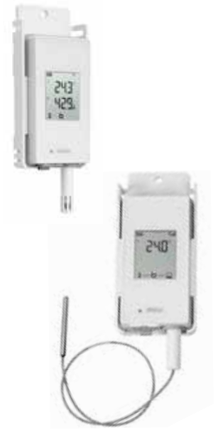
VaiNet RFL 100 数据记录仪