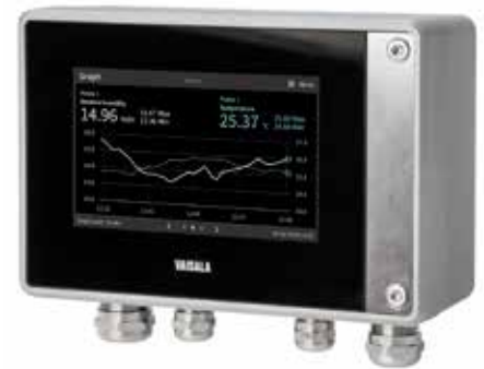
用于湿度、温度、露点、油中水分、CO 2 和 H 2 O 2 探头的 Indigo 500 系列变送器

现场校准是检验和验证测量准确度的一种快速方法。通过 Indigo 兼容探头，可使用维萨拉 Insight 软件执行校准。Insight 软件自动检测并连接多达六个探头。该软件提供直观的图形用户界面，易于访问诊断数据和设备特定的高级功能，如事件日志、参数备份副本或校准证书的电子副本。数据可导出到电子表格。可从以下网址下载 Insight 软件： www.vaisala.com/insight 。