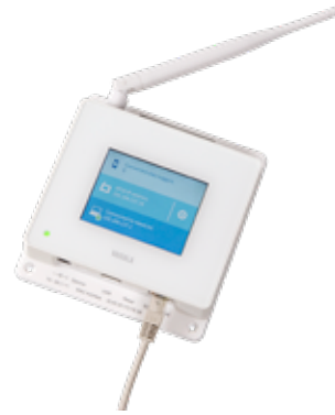
VaiNet AP10 接入点