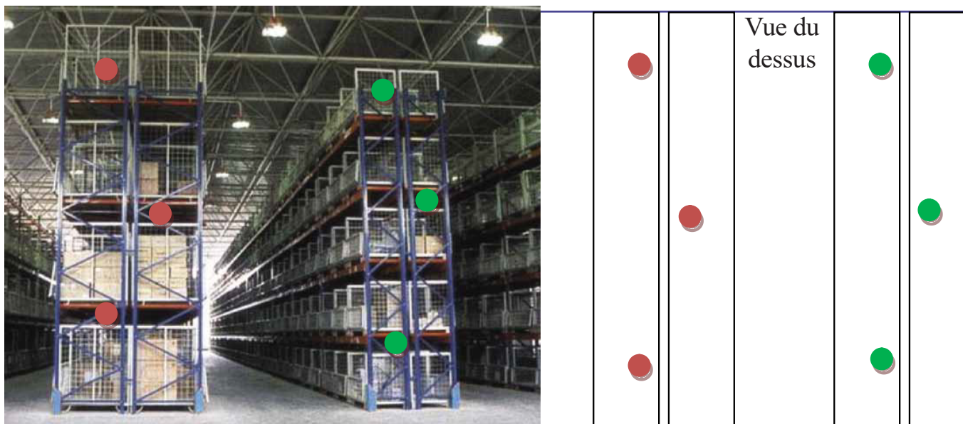
Figure 2 : Les capteurs placés au milieu des racks reflètent plus précisément les températures effectives des produits. Dans cet exemple, neuf capteurs sont placés sur chaque double rack dans un entrepôt de 30 mètres par 30 mètres sur 15.