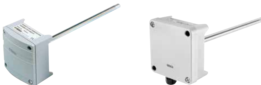
Tableau comparatif du transmetteur de température et d'humidité HUMICAP® HMD60/70 et du transmetteur de température et d'humidité HUMICAP® HMD60