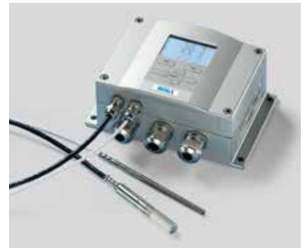
维萨拉 HUMICAP® 湿度和温度变送器 HMT337