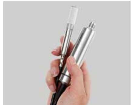
维萨拉 HUMICAP® 湿度和温度探头 HMP7