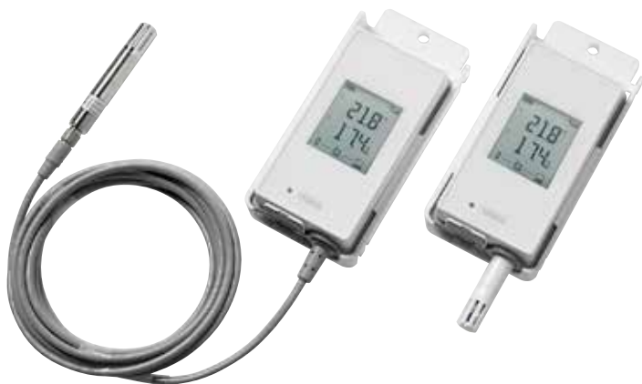
Enregistreur de données de température et d'humidité sans fil VaiNet RFL100 pour la surveillance sans fil des zones contrôlées