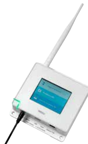
Point d'accès sans fil VaiNet AP10 pour la mise en réseau des enregistreurs de données de la série RFL VaiNet

des informations précises sur les conditions à l'intérieur du mausolée, n'importe où, n'importe quand. »