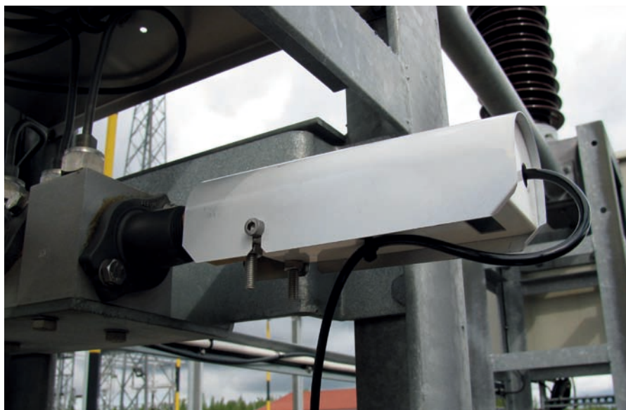
図2:「センサ・ブロック」に取り付けられた屋外での設置

この設置の方法は、圧力や密度の計測では問題になりませんが、露点計測の場合には誤った結果につながる恐れがあります。ガス管内の水分移動に伴う水蒸気は極めて少量ですが、少量の静止気体でオンライン計測を行えばはっきりと分かります。