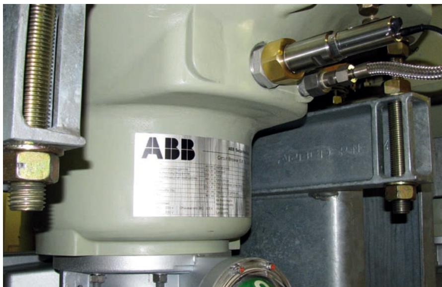
図5: 本体のガスタンクに直接取り付けられた、露点・圧力・温度センサ (DPT145) (2010年3月25日～4月14日)。計測セル内のガス量は約20ml。

これまで述べたように、取り付けの際に、当初の水分の流入を最小限に抑えることが非常に大切です。水滴がセンサのコネクタに入り込むのを防ぐため、雨天の設置作業は不適です。また、シーリングの表面にちりやほこりの粒子が残らないよう、細心の注意を払わなくてはなりません。なぜなら、これらは後に水分子拡散の媒体となる可能性があり、計測を台無しにするばかりか、最悪の場合はSF6を湿潤化するためです。屋外の設置では、水が接合点にたまり蒸気拡散を増加させることがないよう、雨よけを取り付ける必要があります。