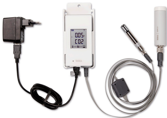
2つのTMP115プローブ(上)、 GMP251およびHMP110プローブ(下)を備えたRFL100