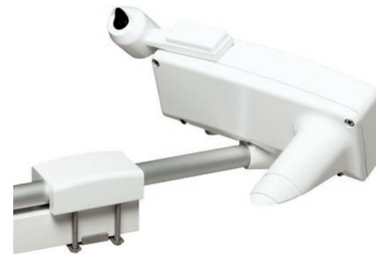
O Sensor de Luminação PWL111 da Vaisala opcional fornece as informações sobre luminância necessárias para o relatório de visibilidade da aeronáutica com o uso da AWOS. Pode-se utilizar o PWL111 como um interruptor diurno/noturno ou no modo de medição de luminância contínuo.

Com uma variação de 10-2.000 metros, o Sensor de Visibilidade PWD10 da Vaisala possibilita medições de visibilidade econômicas e confiáveis para aplicações em estradas. Recomenda-se o uso do sensor PWD 10 para sistemas de condições meteorológicas em estradas que alertam os motoristas, como por exemplo, sobre a redução de visibilidade.