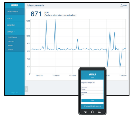
无线配置接口示例（桌面和移动视图）

有关 Indigo 数据处理单元和 Indigo 产品系列的更多信息，请参见 www.vaisala.com/indigo 。