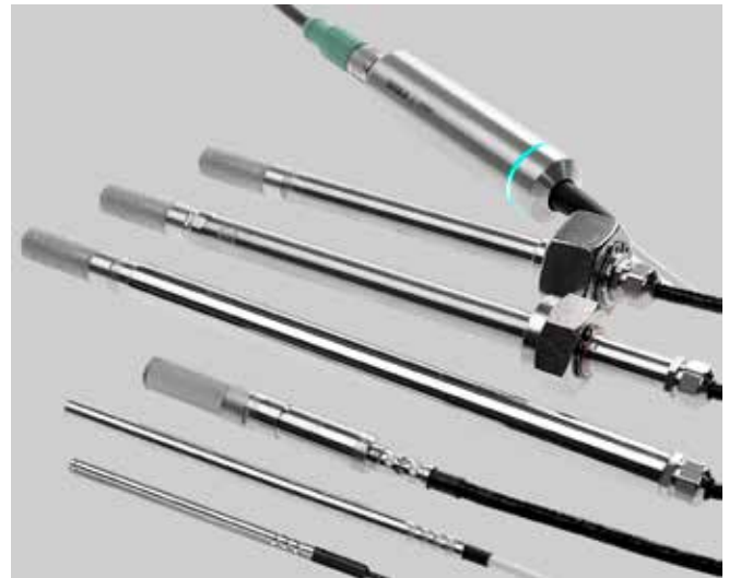
Sondas de humedad y temperatura compatibles con Indigo