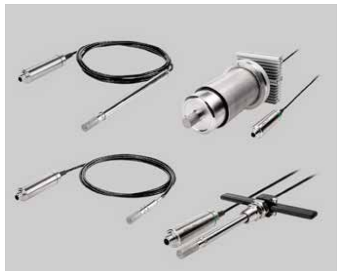
Sondas de punto de rocío compatibles con Indigo