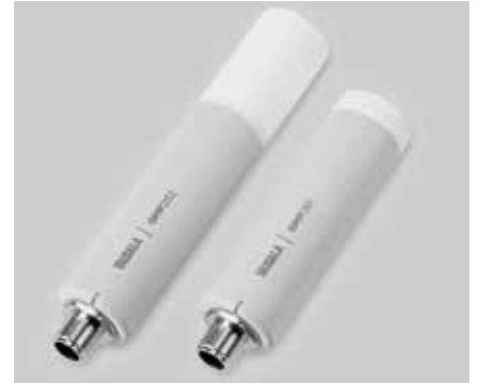
Sondas GMP251 y GMP252