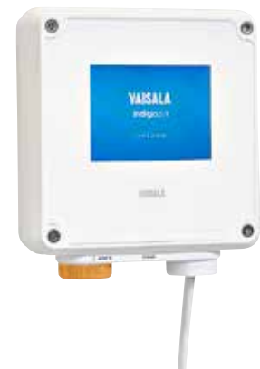
Otro transmisor Indigo serie 200 de Vaisala