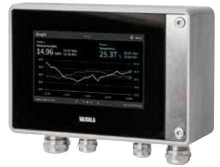
Otro transmisor Indigo serie 500 de Vaisala.