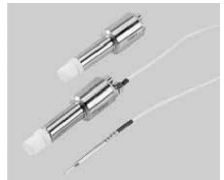
Sondas HPP271 y HPP272