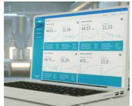
Software de Vaisala Insight para PC

El software que cuenta con una interfaz gráfica de usuario intuitiva, también permite la calibración y los ajustes del campo de la sonda. También permite una prueba y evaluación fáciles - la función de registro de datos de 48 horas permite registrar simultáneamente datos de hasta seis dispositivos, y se lo puede exportar de forma fácil en formato legible por Excel.