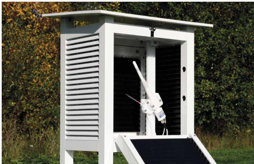
HMP155 com um estável sensor 180R HUMICAP® e uma sonda de temperatura adicional

A sonda de Umidade e Temperatura HMP155 do Vaisala HUMICAP® proporciona medições confiáveis de umidade e temperatura. Projetado especialmente para aplicações externas indispensáveis.