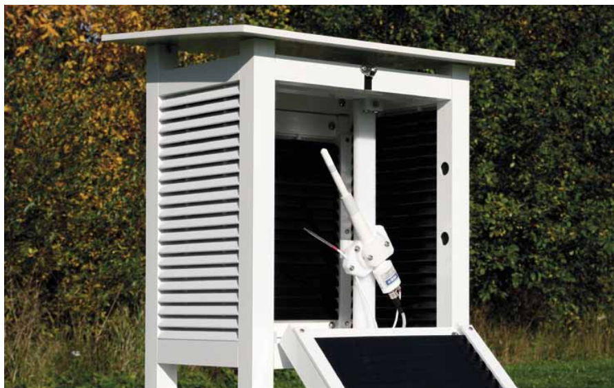
Sonda HMP155 con estable sensor HUMICAP®180R y una sonda adicional de temperatura.