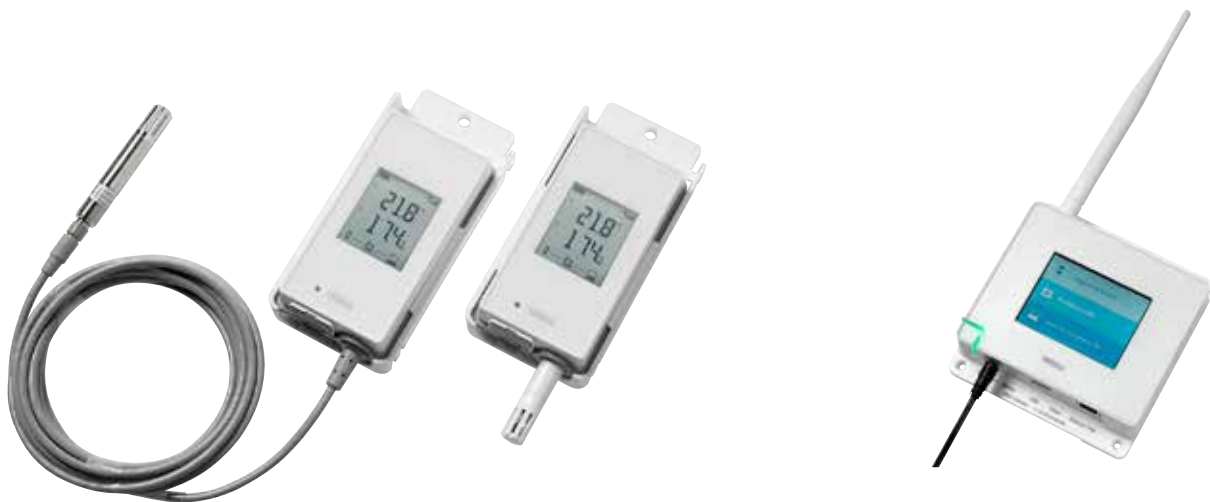
用于受控区域的无线监测的 Vaisala 无线温湿度数据记录仪 RFL100