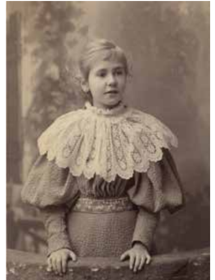
希格瑞德·朱瑟柳斯

希格瑞德·朱瑟柳斯陵墓是芬兰波里的重要文化遗址。这座陵墓建于 1901-1903 年，是一件代表了当时的艺术和工艺的杰作。陵墓的墙为砂岩墙，室内还装饰着丰富的壁画，因此非常难以保存。在该建筑完工的最初几年里，原始壁画由于吸附了过多水分而遭到破坏，后来进行了重新绘制。希格瑞德·朱瑟柳斯基金会拥有该建筑的所有权，也负责管理该建筑，为了持续准确地监测其中的湿度和温度，让这座出色的建筑物保持在良好的状态，基金会最近购买了维萨拉的高新技术。