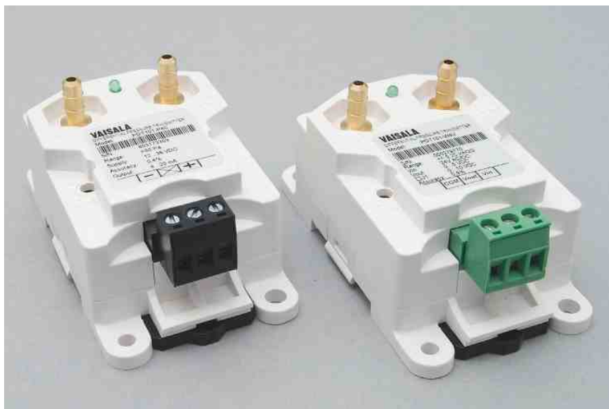
维萨拉微差压变送器PDT101可选电流输出（黑色）或电压输出（绿色）