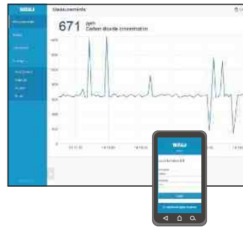
Beispiel eines WLAN Konfigurationsfensters.

Der Indigo 201 verfügt über eine WLAN-Konfigurationschnittstelle für ein Mobilgerät bzw. einen Rechner mit