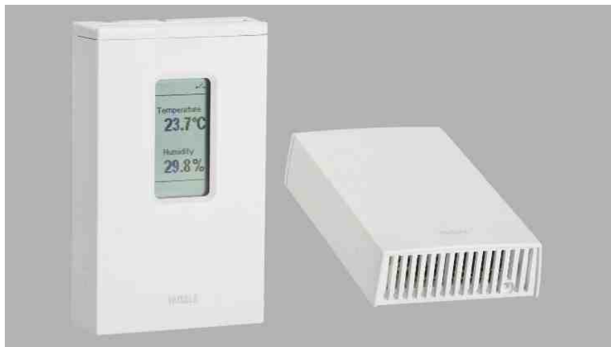
Die Feuchte- und Temperaturfühler der Serie HMW90 wurden für anspruchsvolle HLK-Anwendungen ausgelegt.

Die Vaisala HUMICAP® Raumfeuchte- und Temperaturfühler der Serie HMW90 dienen der Messung der relativen Feuchte und der Temperatur bei HLK-Innenanwendungen, die eine hohe Genauigkeit, Stabilität und einen zuverlässigen Betrieb erfordern.