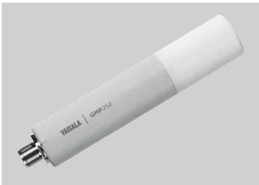
用于二氧化碳 (CO 2 ) 测量的GMP252系列 - ppm级智能传感器

维萨拉CARBOCAP® GMP252系列二氧化碳传感器是一种测量二氧化碳用的新型智能传感器。这种耐用、独立测量装置可用于农业、制冷、绿色温室大棚和要求较高的暖通空调等领域。它适用于恶劣的和潮湿的但要求稳定和准确测量ppm级二氧化碳的环境中。GMP252系列基于维萨拉公司独特的第二代CARBOCAP®技术，具有优异稳定性。它使用一种新型的红外线光源取代了传统的白炽灯泡，延长了GMP252系列的使用寿命。