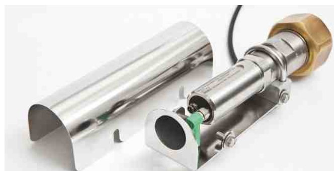
DPT145 mit Wetterschutzgehäuse

eine innovative und praktische Lösung zur Überwachung von SF6-Gas geboten.