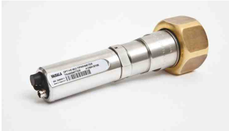
DPT145 ausgerüstet mit dem DILO DN20 Schraubverbinder

Der Vaisala Multiparameter Messwertgeber DPT145 für SF6-Gas ist eine Innovation, mit der Onlinemessungen von Taupunkt, Druck und Temperatur möglich sind. Darüber hinaus errechnet das Gerät vier weitere Werte, einschließlich der SF6-Dichte. Es ist besonders geeignet zur Integration in OEM-Systeme.