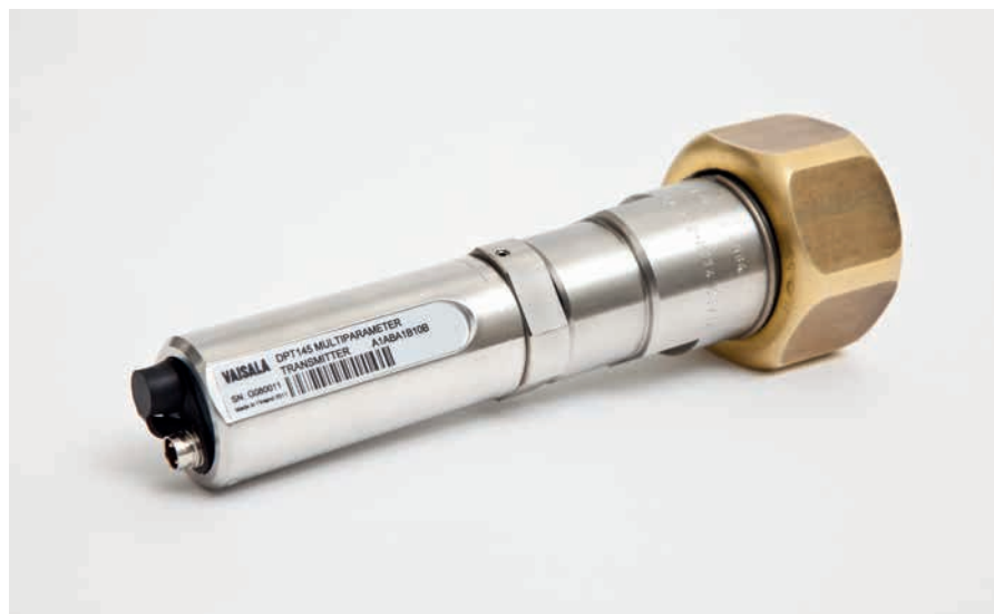
DILO DN20コネクタを装着したヴァイサラマルチパラメータ変換器DPT145

ヴァイサラDPT145 SF6ガス用マルチパラメータ変換器は、露点、圧力、温度のオンライン計測を可能にした革新的な独自開発製品で、このほかSF6濃度など4項目の値を演算します。特に、OEMシステムへの組み込みに最適です。