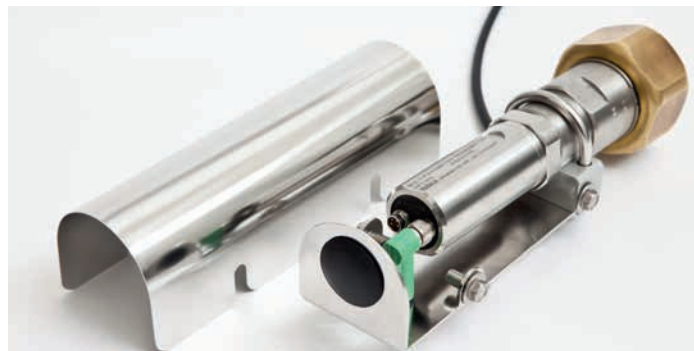
耐候性シールドを装着したDPT145

ヴァイサラには70年以上にわたる豊富な計測実績と知識があります。DPT145は実績のあるDRYCAP®露点センサ技術とBAROCAP®気圧センサ技術を一つのパッケージにまとめたもので、SF6ガスモニタリングについてイノベーションを駆使した便利なソリューションを提供しています。