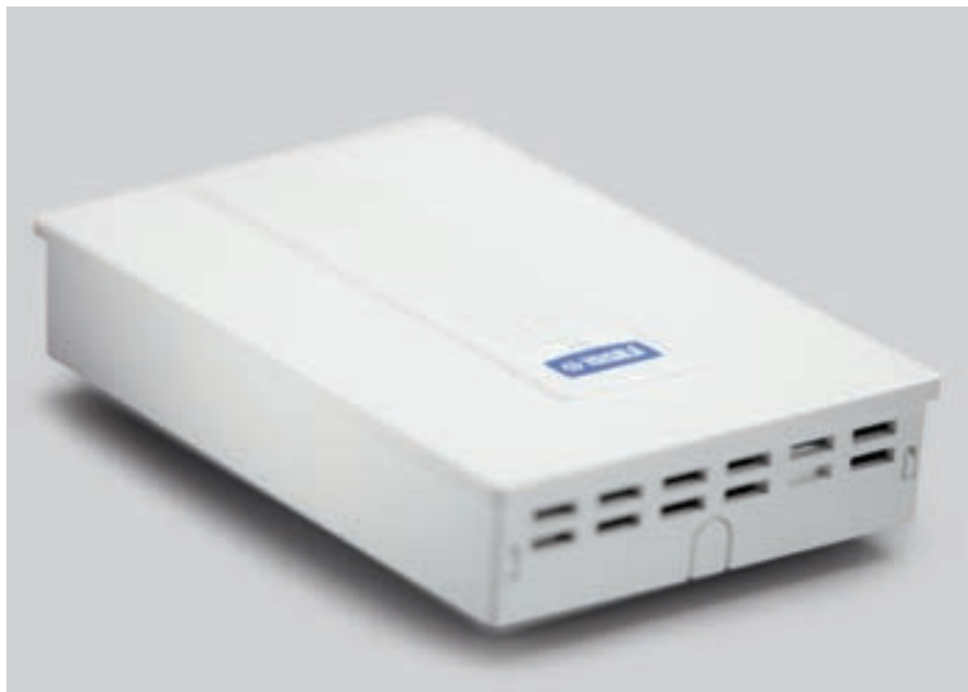
Vaisala CARBOCAP® koldioxidmätaren GMW115 är en väggmonterad CO 2 -mätare för behovstyrd ventilation.