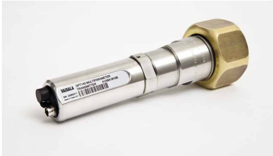
DPT145 ausgerüstet mit dem DILO DN20 Schraubverbinder

Der Vaisala Multiparameter Messwertgeber DPT145 für SF6-Gas ist eine Innovation, mit der Onlinemessungen von Taupunkt, Druck und Temperatur möglich sind. Darüber hinaus errechnet das Gerät vier weitere Werte, einschließlich der SF6-Dichte. Es ist besonders geeignet zur Integration in OEM-Systeme.