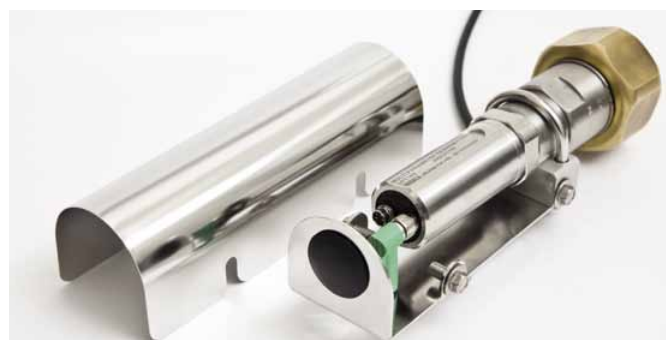
DPT145 mit Wetterschutzgehäuse

Vaisala verfügt über mehr als 70 Jahre Erfahrung und Wissen auf dem Gebiet der Messtechnik. Mit dem DPT145 werden die bewährte DRYCAP®-Taupunktsensortechnologie und die BAROCAP®-Drucksensortechnologie in einem Gerät kombiniert und damit eine innovative und praktische Lösung zur Überwachung von SF6-Gas geboten.